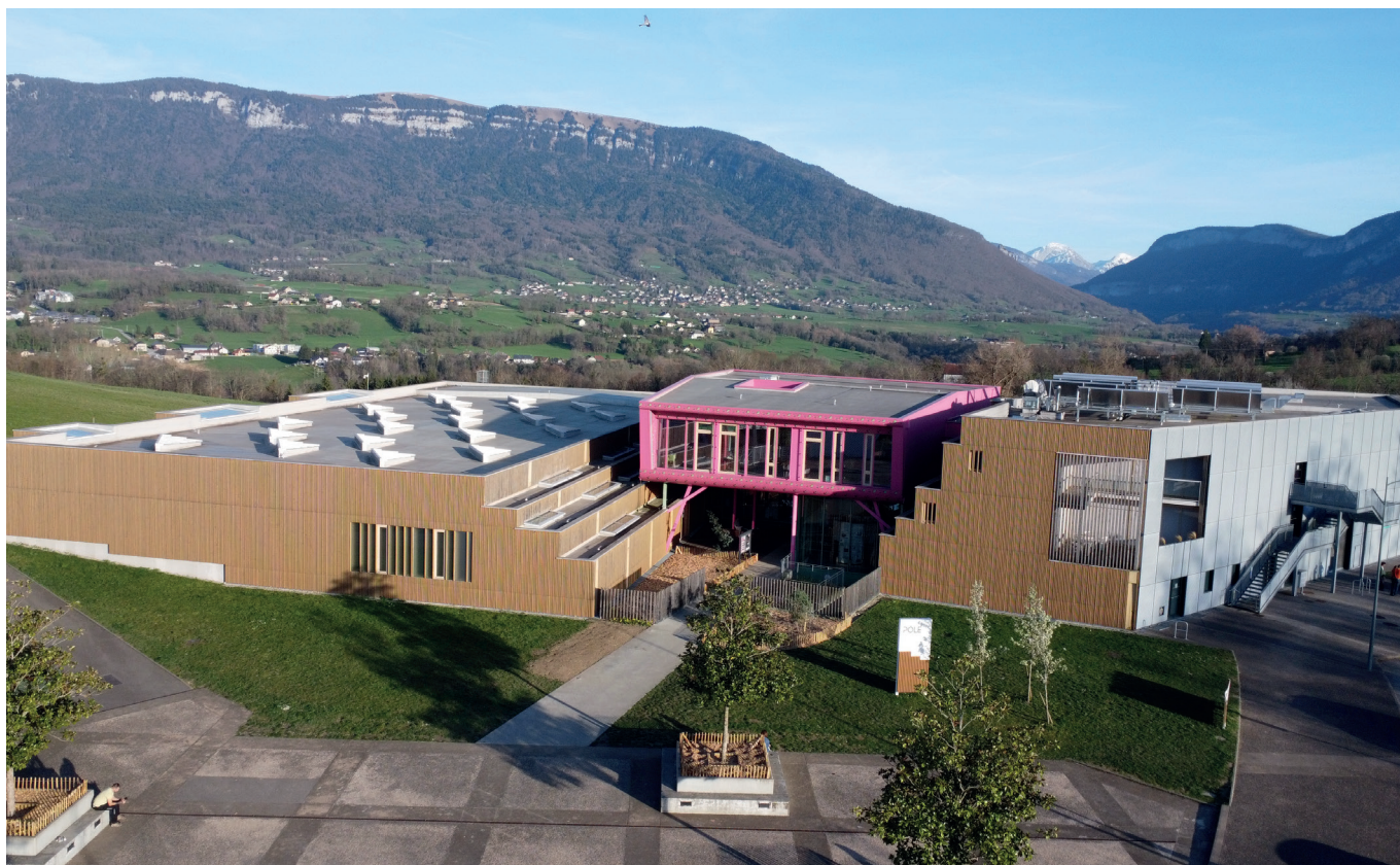
Le Pôle, espace culturel et sportif du Pays d'Alby