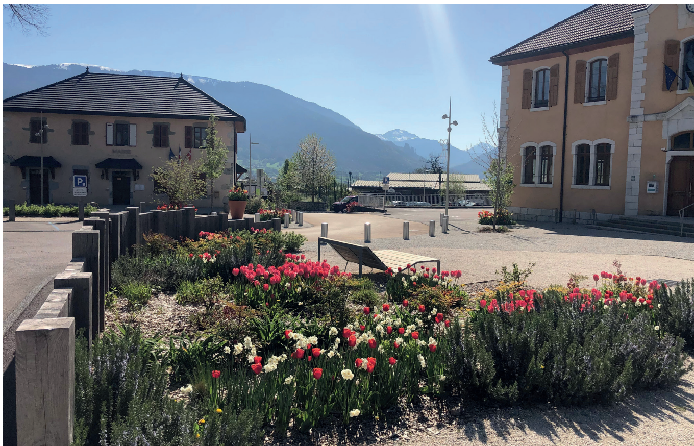
Centre du village