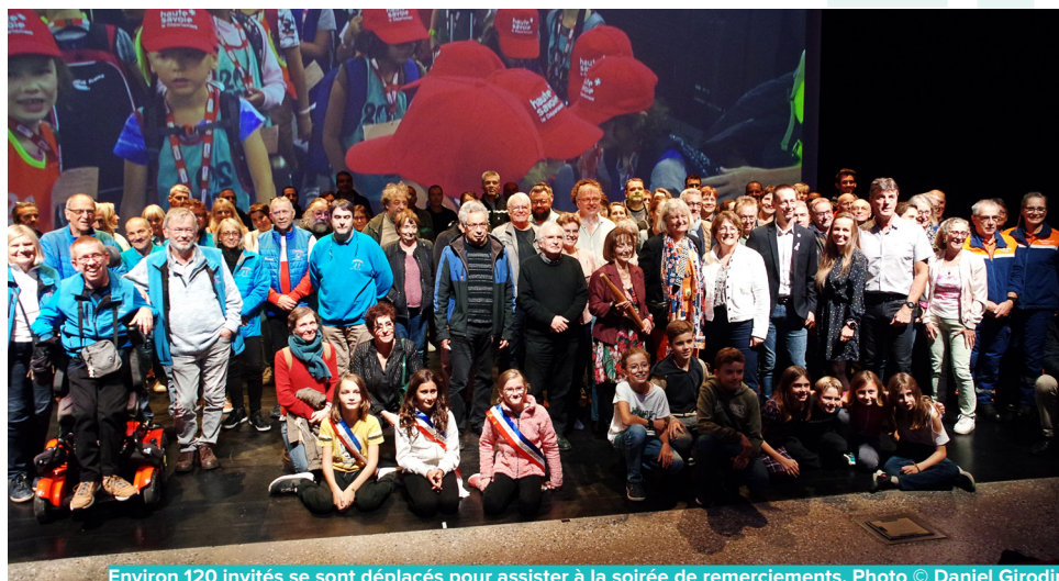
Environ 120 invités se sont déplacés pour assister à la soirée de remerciements.